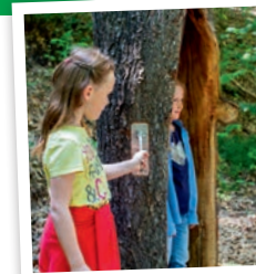
Holz zum Klingen bringen...

Der Walderlebnispfad führt Euch rund 4 km durch unseren Wald zwischen Buchen und Hollerbach und zurück. Unterwegs könnt Ihr einige Erlebnisstationen erkunden und erfahren, welche Bäume in unseren Wäldern wachsen. Wir zeigen Euch die Tiere des Waldes und erläutern Besonderheiten unserer Landschaft.